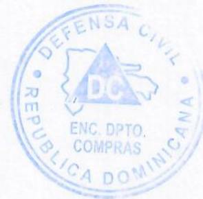
Melbin Rondón Brito Compras D.C.

Observaciones: (Indicar Observaciones, si las hay)